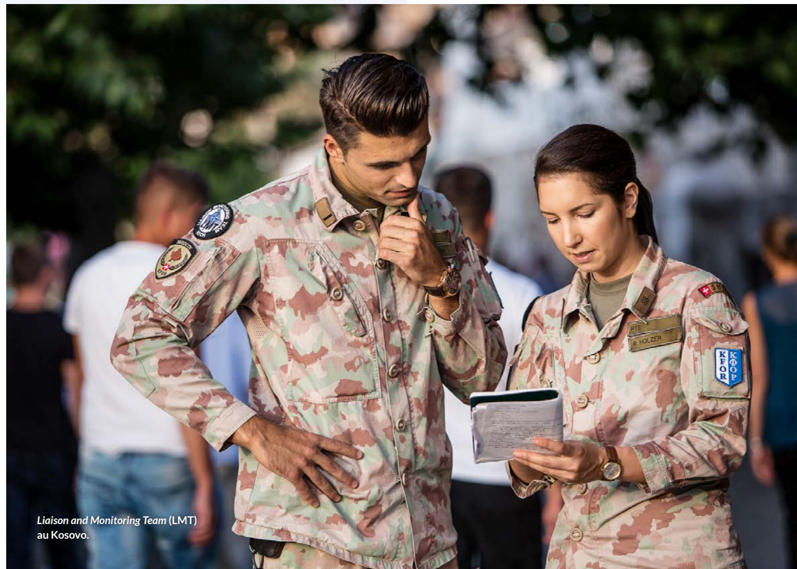
Liaison and Monitoring Team (LMT) au Kosovo.