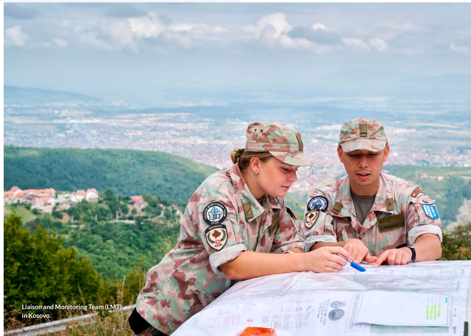
Liaison and Monitoring Team (LMT) in Kosovo.