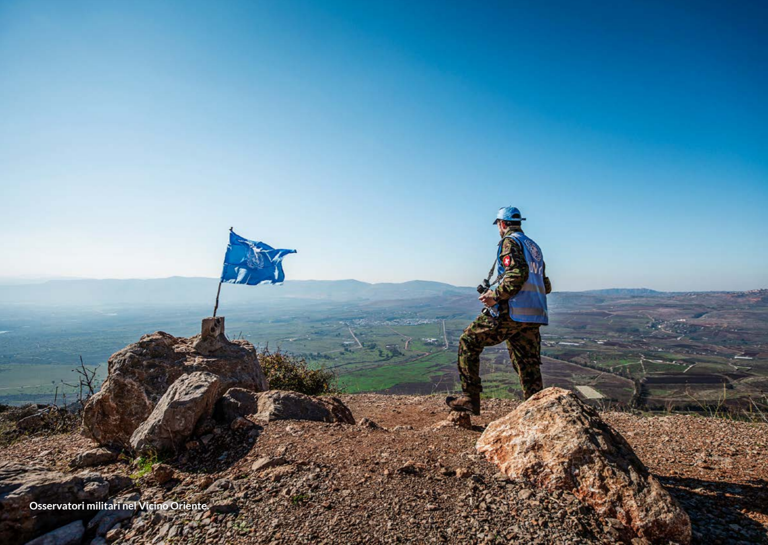
Osservatori militari nel Vicino Oriente.